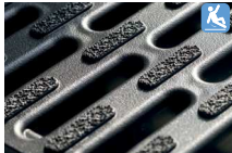
Rejilla microgrip de plástico anti-deslizante